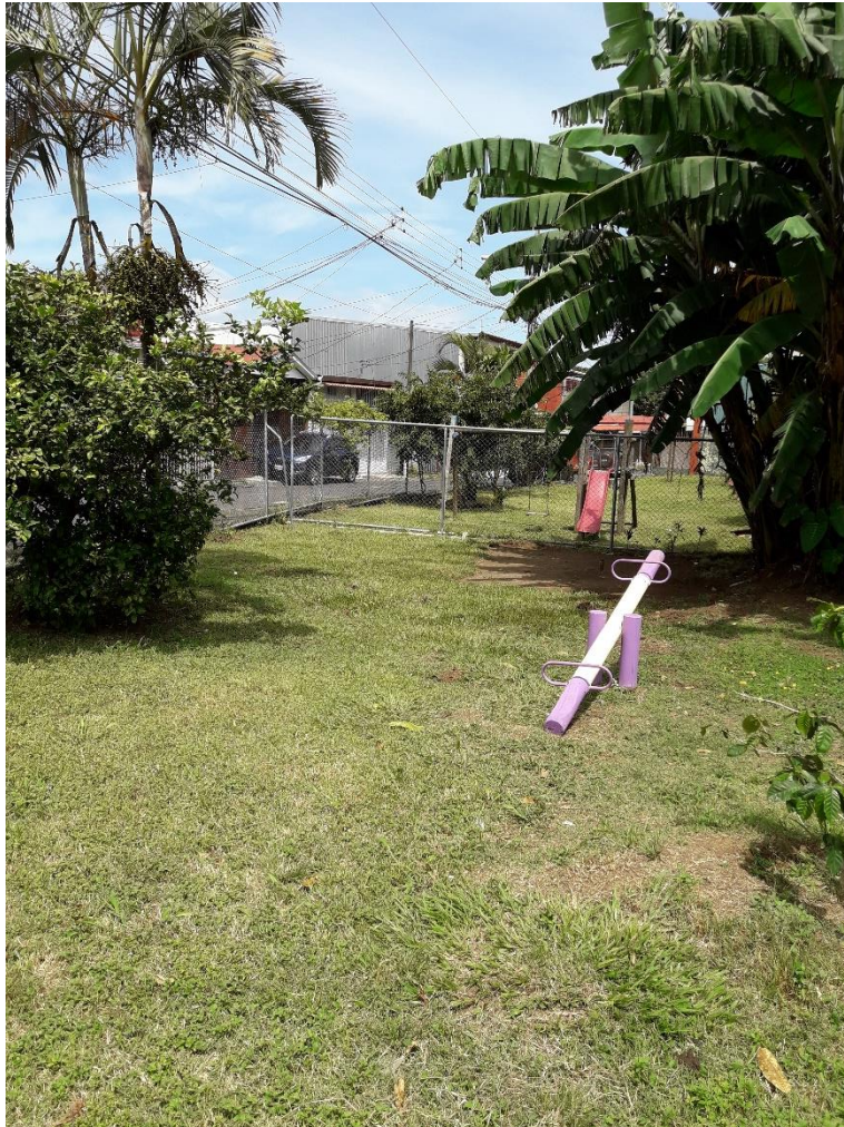
Figura 3: Parque por Donde se Desviará la Tubería Existente

La propuesta de diseño es desviar dos tramos de la red de alcantarillado sanitario existente de esta urbanización que, actualmente, están descargando en un puente canal colapsado. El desvío de la tubería atravesará un parque municipal y se conectará a otra parte de la red que fluye hacia otro puente canal cercano, el cual está en buen estado. Esta interconexión a la red existente se realizará en calle pública. En total se plantea la instalación de 130.37 m de tubería de polietileno de alta densidad ASTM F2947 de 200 mm de diámetro, 7 pozos de registro y la reconexión de las previstas domiciliarias que se vean afectadas con el proyecto.