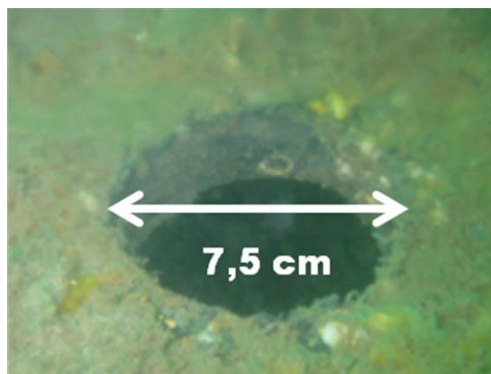
Fotografía 4. Diámetro de difusores.