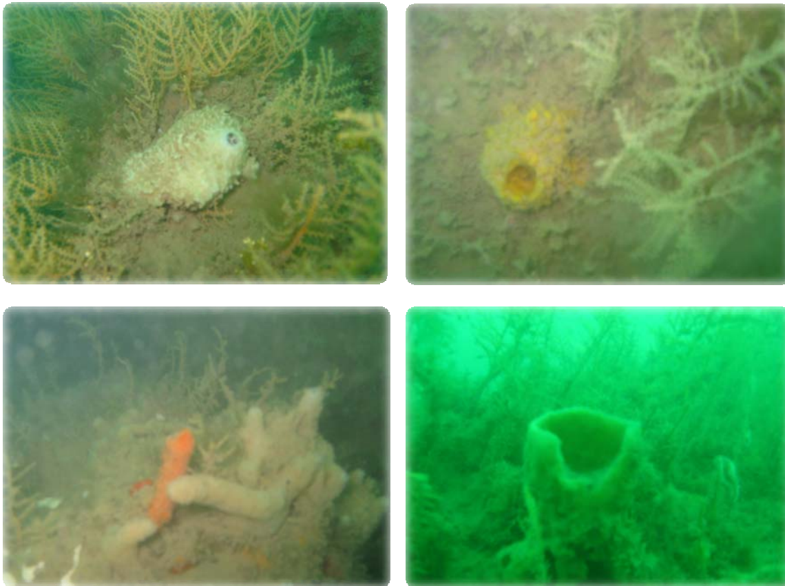
Fotografía 1. Flora y fauna encontrada sobre la tubería y anclajes de concreto.

Se ubicó la tubería y se inició la inspección hacia el extremo donde está la descarga, durante ese recorrido se observó que la vida que cubre este tramo de la tubería es diferente a la que cubre la mayor parte de la tubería ya inspeccionada en ocasiones anteriores. Anteriormente se encontró una formación dura de color blanco y en este último tramo se aprecian algas, algunos peces y otros organismos, los cuales se aprecian en las Fotografías 1 y 2 .