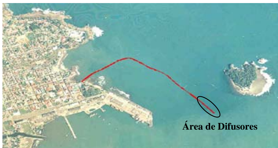
Figura 1. Tramo final del Emisario Submarino (área de difusores).

Se alquiló una lancha similar a la del año pasado para el traslado de los buzos a los distintos puntos de inmersión. Los tanques de aire adquiridos por AyA como parte del equipo de buceo fueron llenados en San José y trasladados a Limón, ya que en Limón no hay estaciones de buceo.