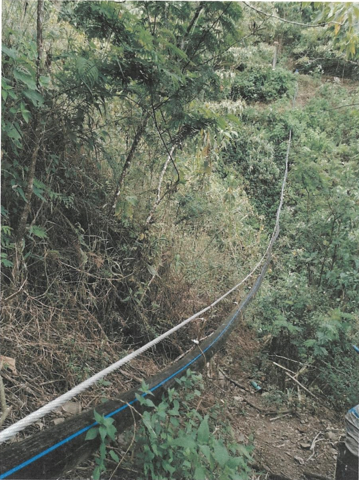
Fotografía 11. Obras de mejoramiento del Acueducto de Llano Bonito de León Cortés.

Informe final de ejecución de Obra del Proyecto de Mejoramiento Del Acueducto de Llano Bonito de León Cortés.