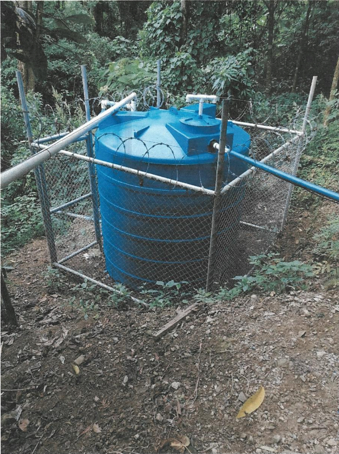
Fotografía 16. Obras de mejoramiento del Acueducto de Llano Bonito de León Cortés.

Informe final de ejecución de Obra del Proyecto de Mejoramiento Del Acueducto de Llano Bonito de León Cortés.