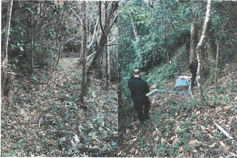
Fotografía 1. Obras de mejoramiento del Acueducto de Llano Bonito de León Cortés. (naciente chico piedra, lugar donde se colocará el sistema de bombeo)

Se adjunta el registro fotográfico de las obras realizadas en los sitios intervenidos.