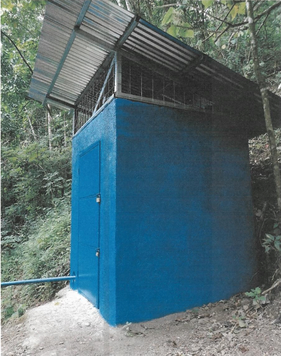
Fotografía 13. Obras de mejoramiento del Acueducto de Llano Bonito de León Cortés.

Informe final de ejecución de Obra del Proyecto de Mejoramiento Del Acueducto de Llano Bonito de León Cortés.