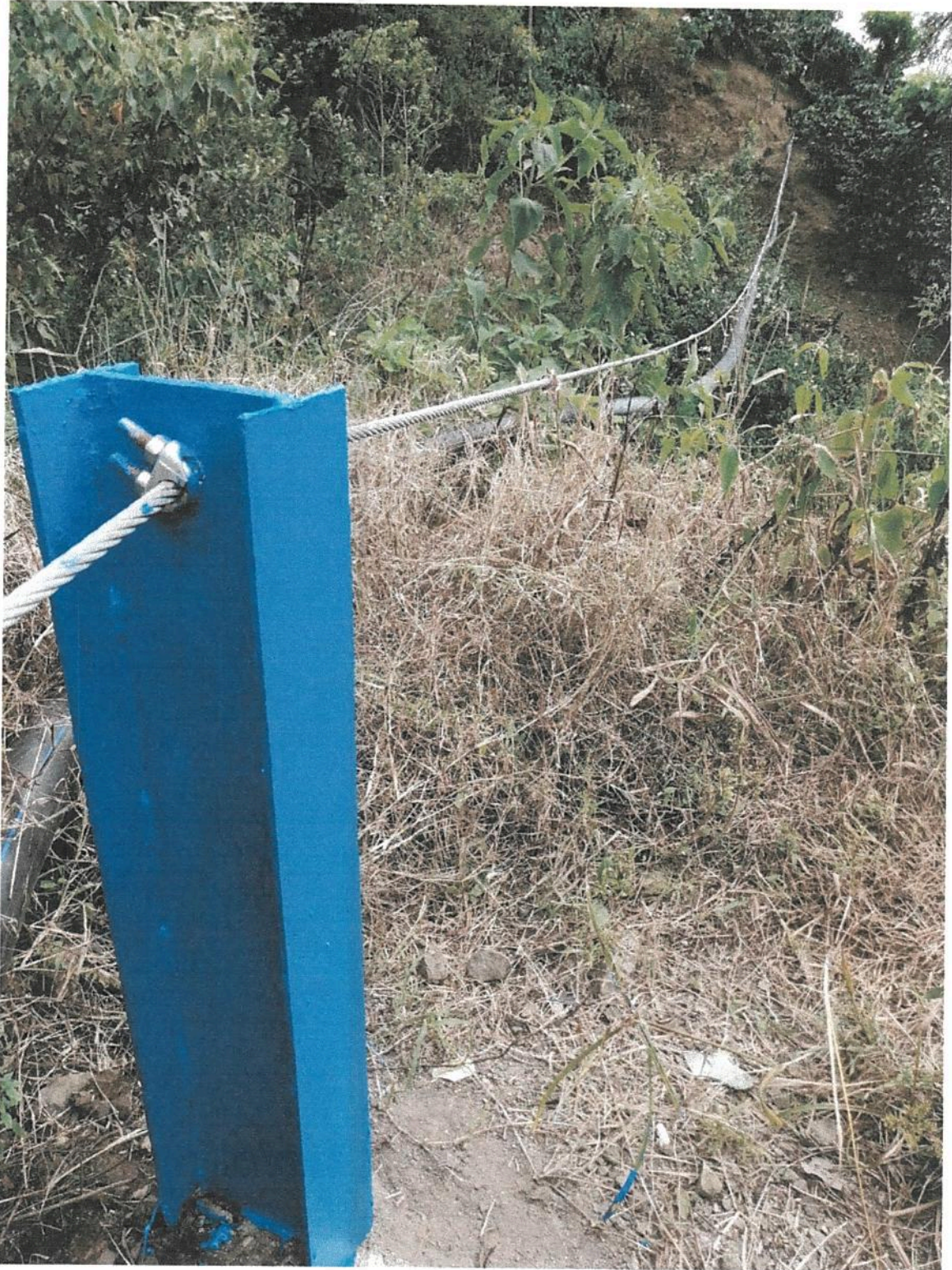
Fotografía 12. Obras de mejoramiento del Acueducto de Llano Bonito de León Cortés.

Informe final de ejecución de Obra del Proyecto de Mejoramiento Del Acueducto de Llano Bonito de León Cortés.