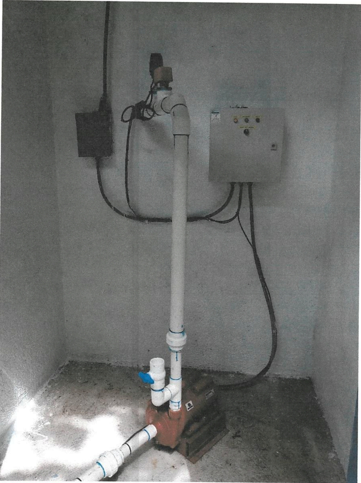
Fotografía 14. Obras de mejoramiento del Acueducto de Llano Bonito de León Cortés.

Informe final de ejecución de Obra del Proyecto de Mejoramiento Del Acueducto de Llano Bonito de León Cortés.