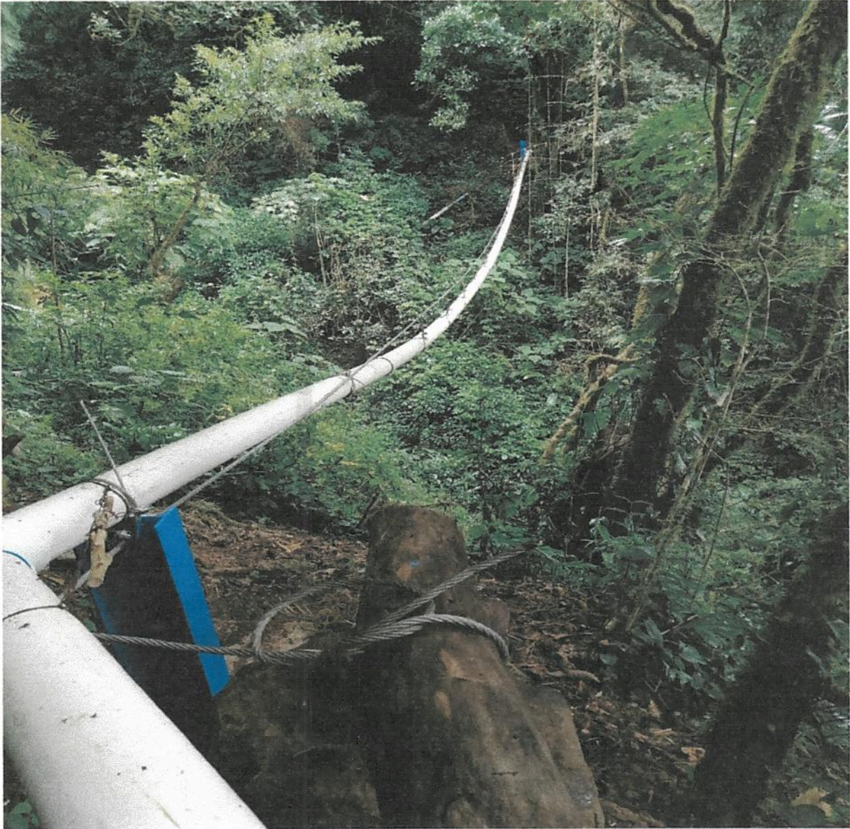
Fotografía 9. Obras de mejoramiento del Acueducto de Llano Bonito de León Cortés.

Informe final de ejecución de Obra del Proyecto de Mejoramiento Del Acueducto de Llano Bonito de León Cortés.