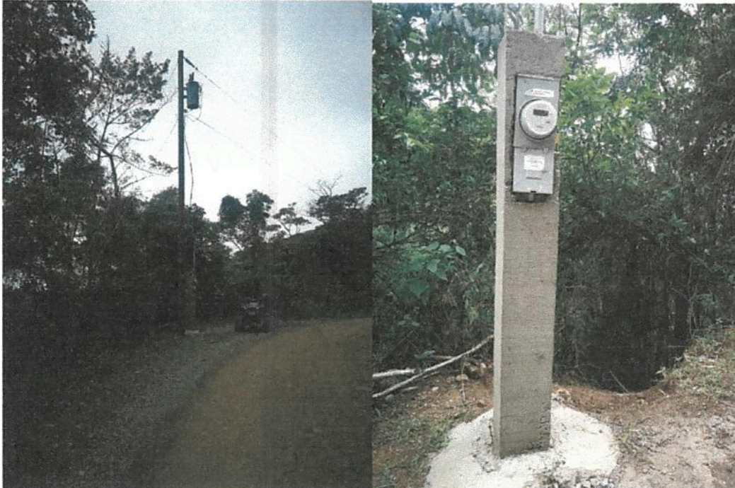
Fotografía 8. Obras de mejoramiento del Acueducto de Llano Bonito de León Cortés. (naciente santa rosa medidor de electricidad).