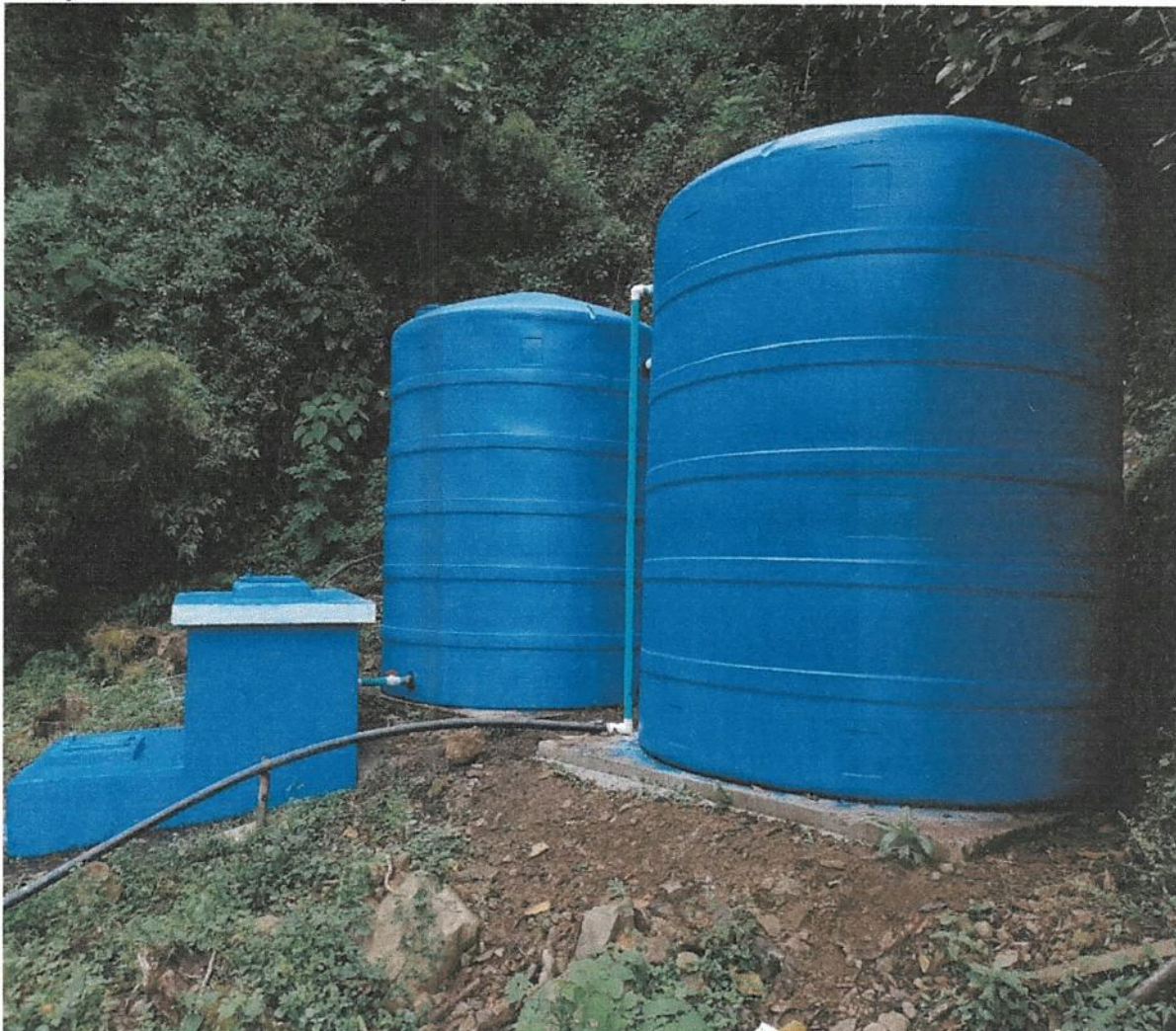
Fotografía 17. Obras de mejoramiento del Acueducto de Llano Bonito de León Cortés.