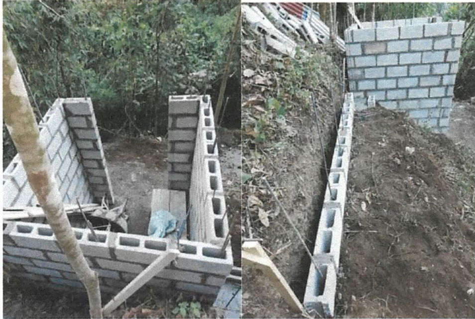
Fotografía 3. Obras de mejoramiento del Acueducto de Llano Bonito de León Cortés. (naciente chico piedra, lugar donde se colocará la caseta de panel de control)