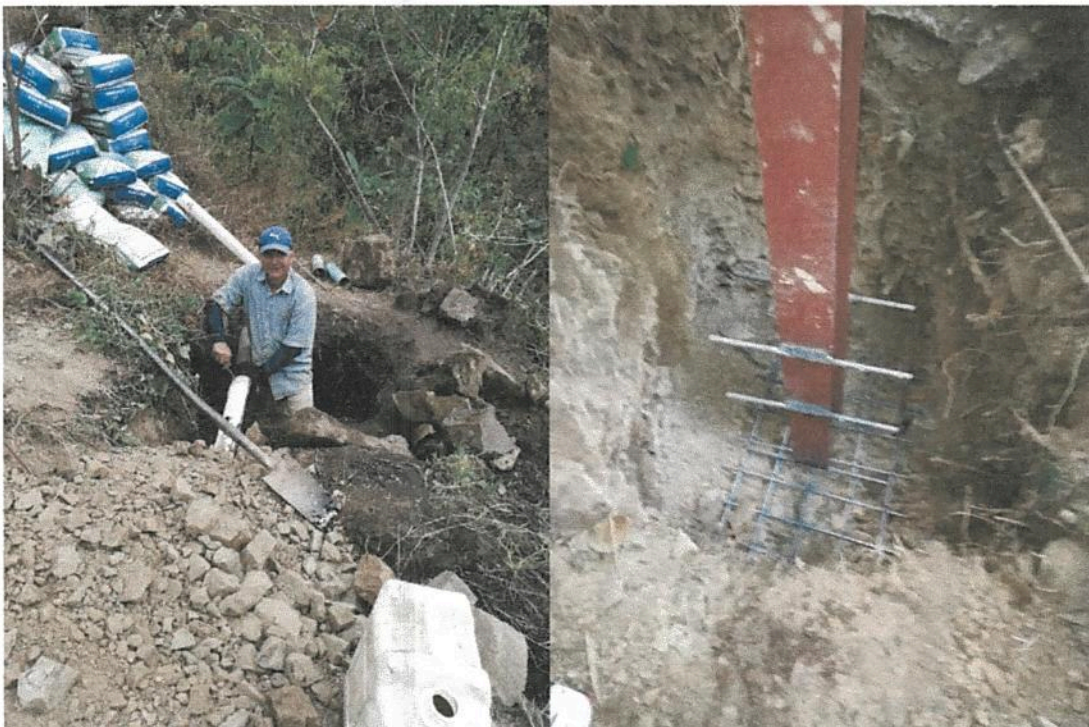
Fotografía 4. Obras de mejoramiento del Acueducto de Llano Bonito de León Cortés. (Viga H de paso elevado de ñeco #1)

Informe final de ejecución de Obra del Proyecto de Mejoramiento Del Acueducto de Llano Bonito de León Cortés.