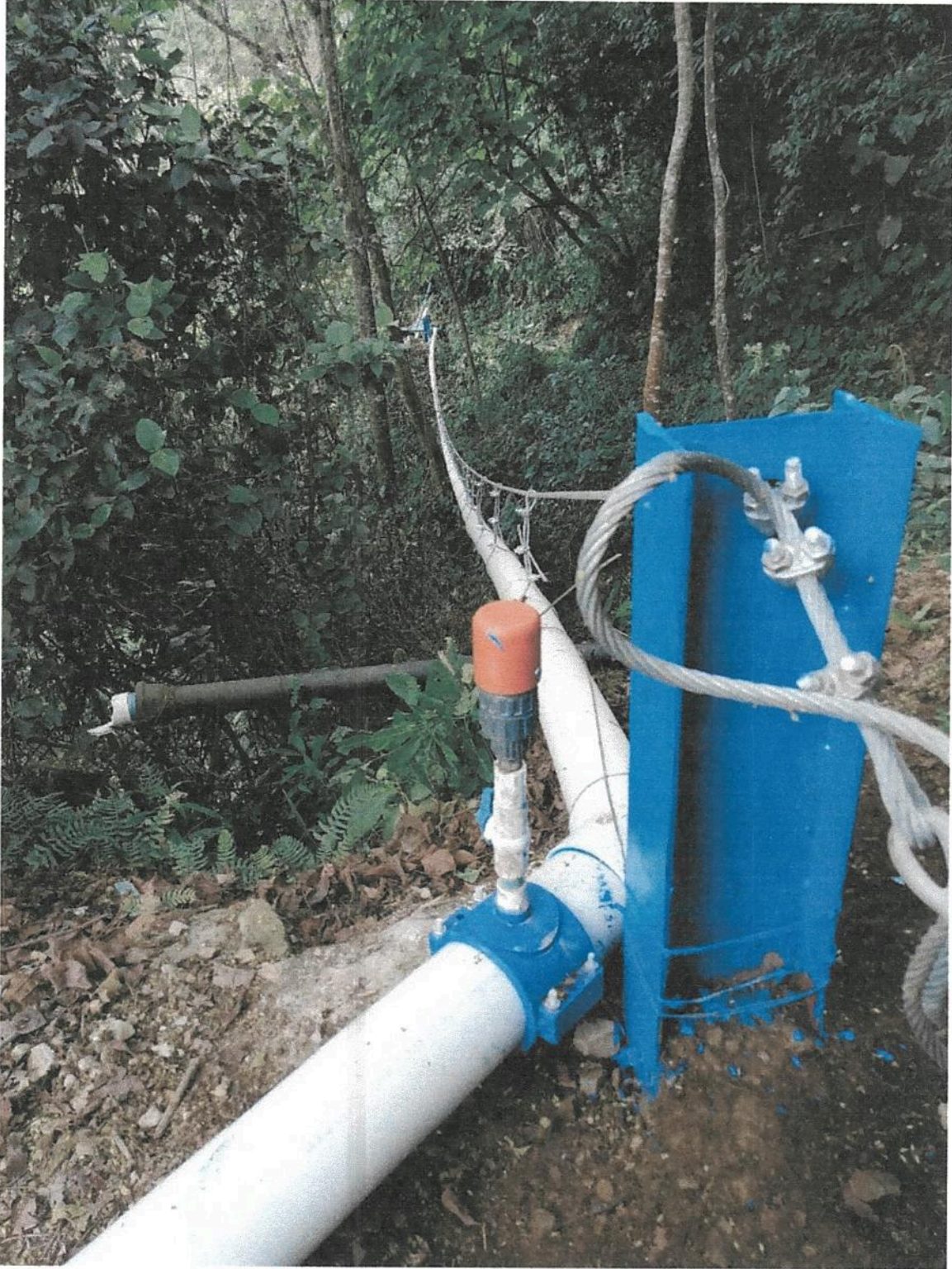
Fotografía 10. Obras de mejoramiento del Acueducto de Llano Bonito de León Cortés.

Informe final de ejecución de Obra del Proyecto de Mejoramiento Del Acueducto de Llano Bonito de León Cortés.