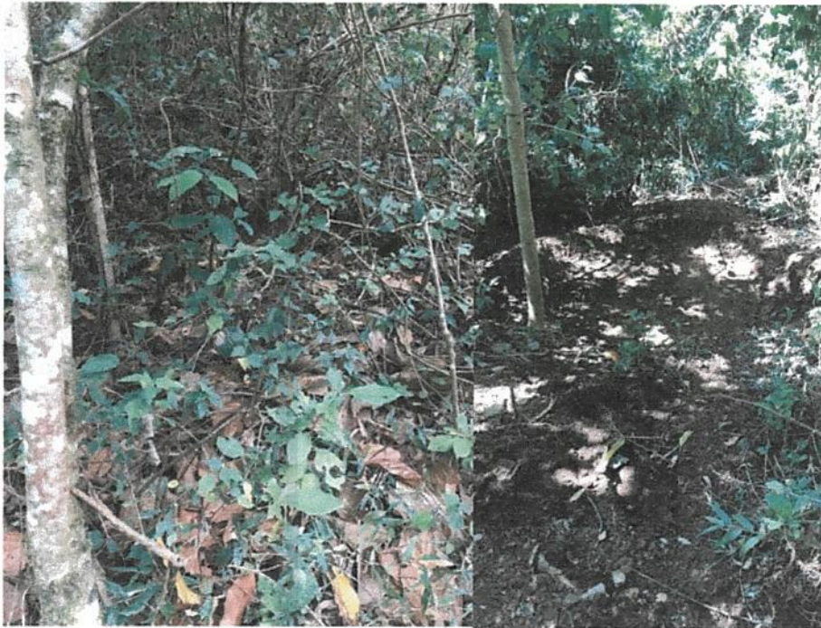
Fotografía 2. Obras de mejoramiento del Acueducto de Llano Bonito de León Cortés. (naciente chico piedra, lugar donde se colocará el tanque de bombeo)

Informe final de ejecución de Obra del Proyecto de Mejoramiento Del Acueducto de Llano Bonito de León Cortés.