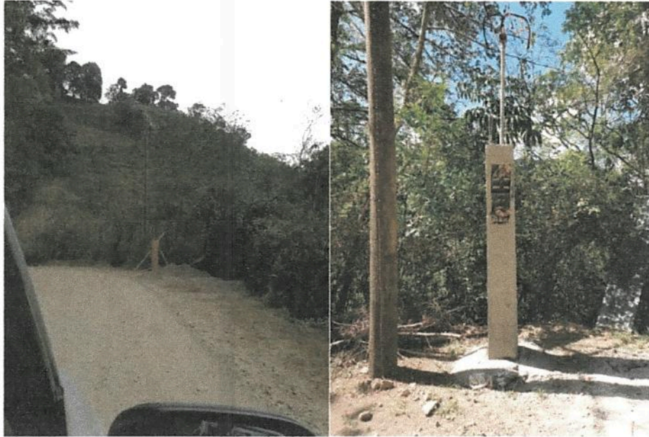
Fotografía 7. Obras de mejoramiento del Acueducto de Llano Bonito de León Cortés. (naciente santa rosa medidor de electricidad)