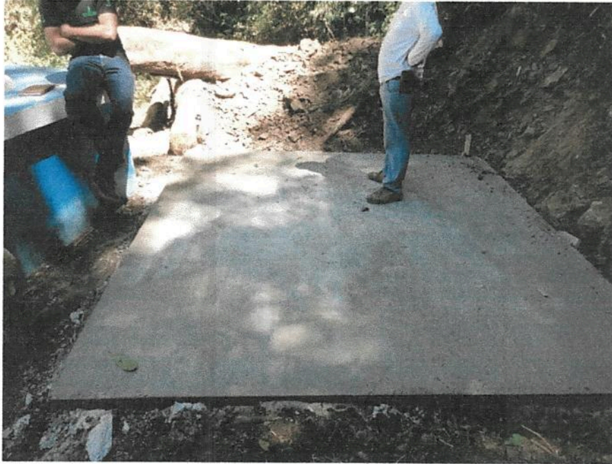
Fotografía 5. Obras de mejoramiento del Acueducto de Llano Bonito de León Cortés. (naciente santa rosa, base para tanque de almacenamiento)