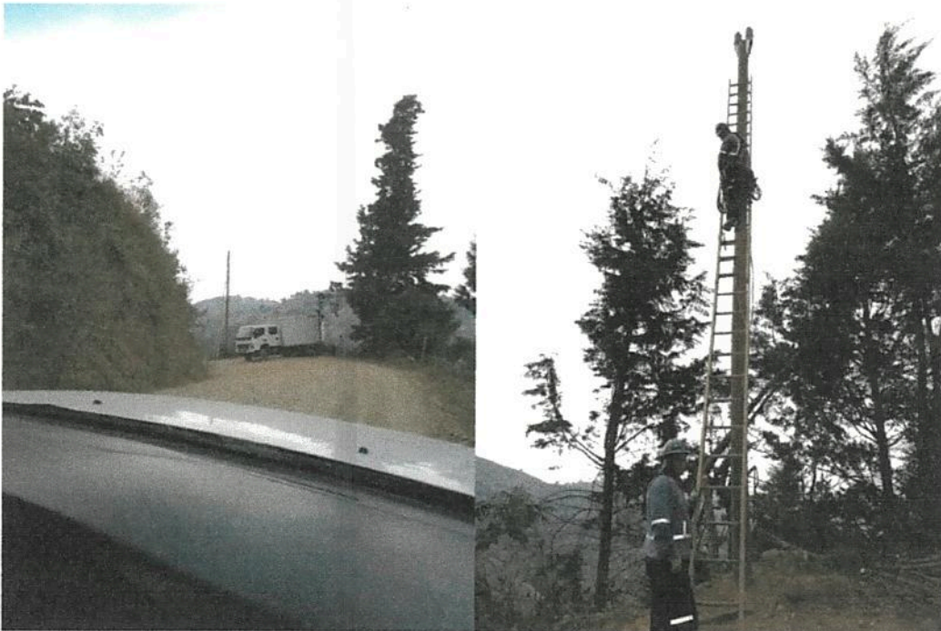
Fotografía 6. Obras de mejoramiento del Acueducto de Llano Bonito de León Cortés. (red eléctrica para caseta de bombeo de san francisco a naciente santa rosa)