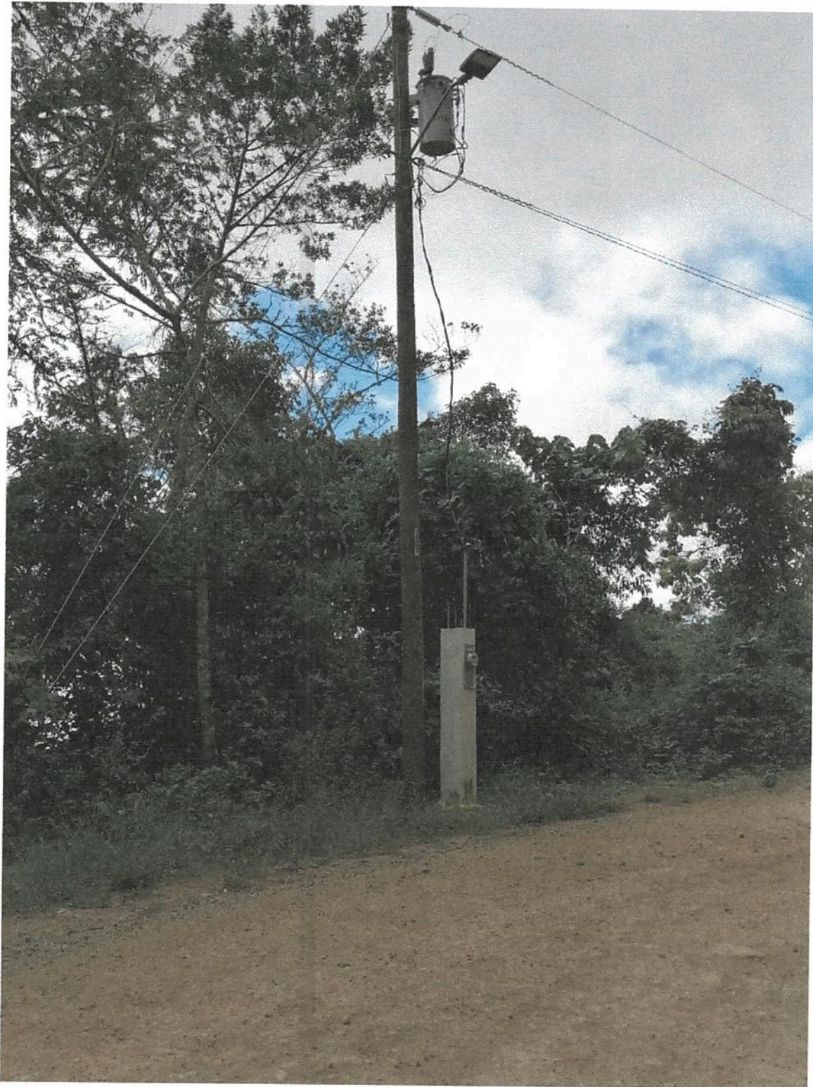
Fotografía 15. Obras de mejoramiento del Acueducto de Llano Bonito de León Cortés.

Informe final de ejecución de Obra del Proyecto de Mejoramiento Del Acueducto de Llano Bonito de León Cortés.